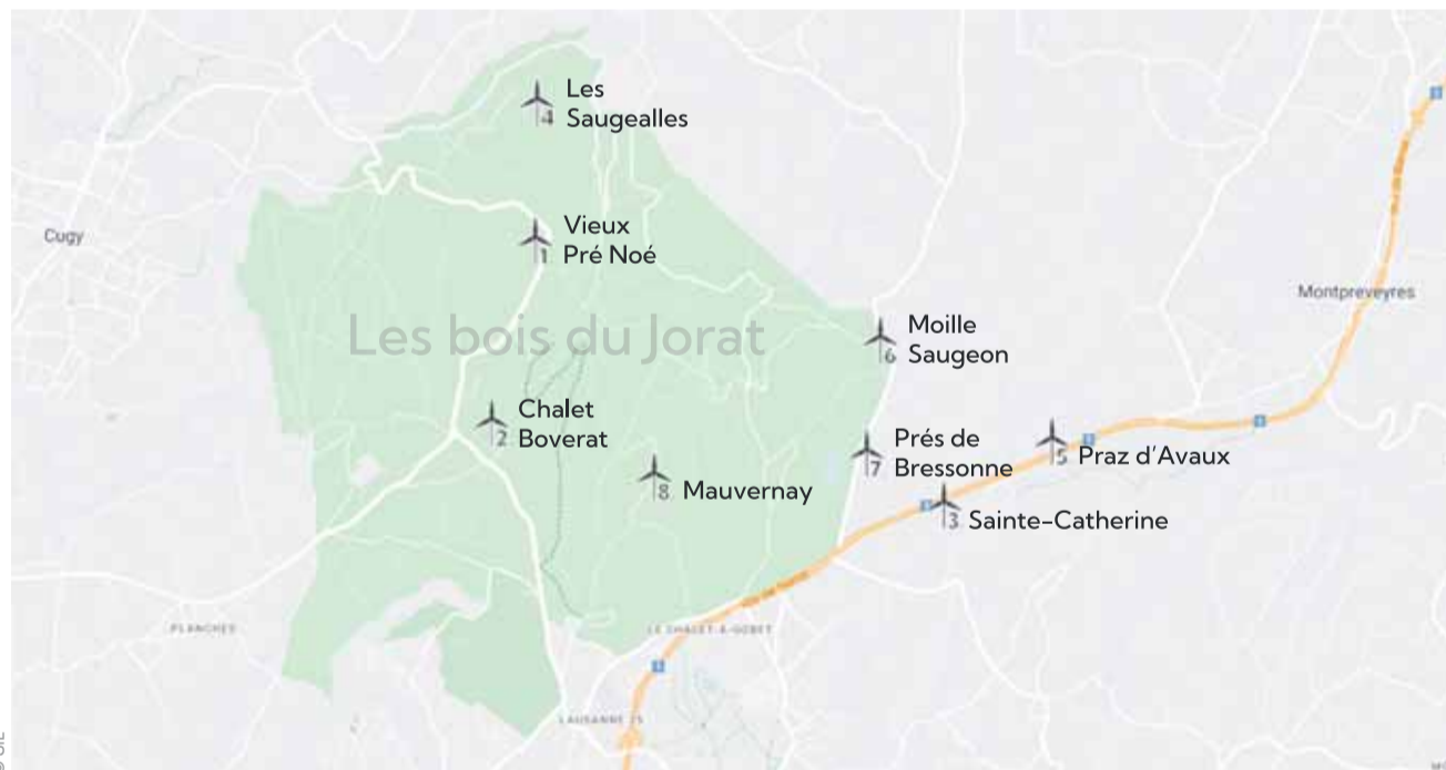
Les emplacements des éoliennes du parc EolJorat Sud.

Nos éoliennes pourront produire entre 55 et 70 GWh par an, c'est-à-dire la consommation annuelle d'environ 22'000 à 28'000 ménages. La proximité des consommatrices et consommateurs de la région lausannoise est un grand avantage en terme d'efficacité énergétique. Les pertes liées au transport sur le réseau d'électricité sont diminuées si la ville est proche. De plus, la proximité des routes et du réseau électrique facilitera la construction du parc et son exploitation en limitant